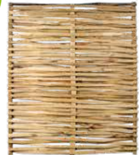
Kent kastanje vlechtscherm