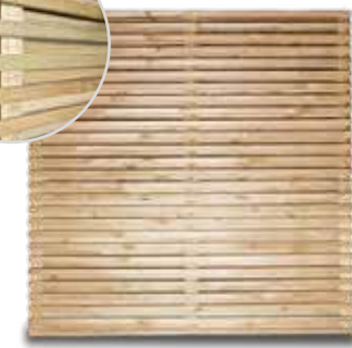
Cordoba duo scherm