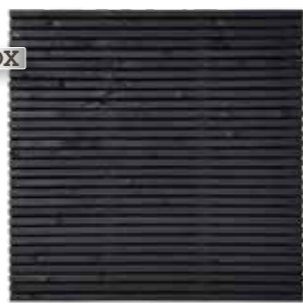
Fino Nero scherm